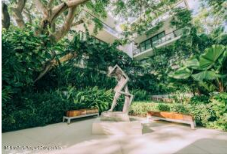
M.S. Valdez Negocios Compañia