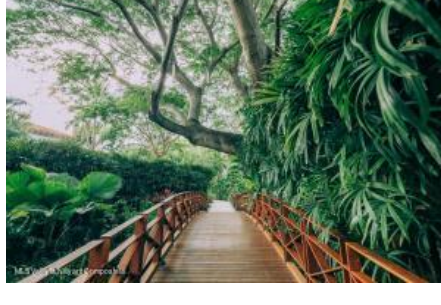
M.S. Valdez Negocios Compañia