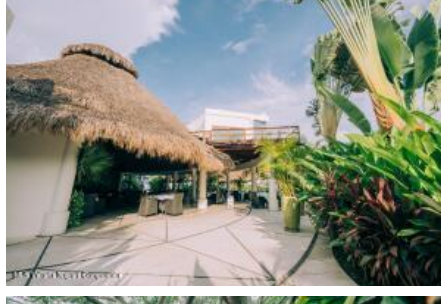
M.S. Valdez Negocios Compañia