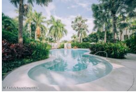
M.S. Valdez Negocios Compañia