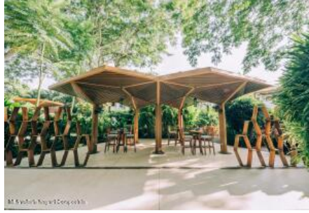
M.S. Valdez Negocios Compañia