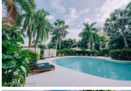
M.S. Valdez Negocios Compañia