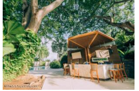
M.S. Valdez Negocios Compañia