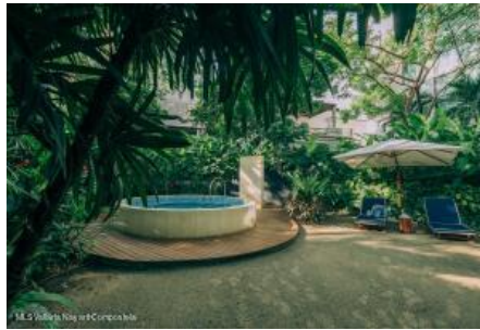
M.S. Valdez Negocios Compañia