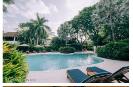
M.S. Valdez Negocios Compañia