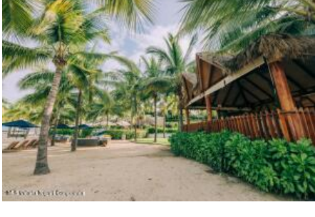
M.S. Valdez Negocios Compañia