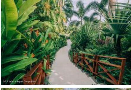
M.S. Valdez Negocios Compañia