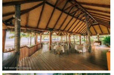
M.S. Valdez Negocios Compañia