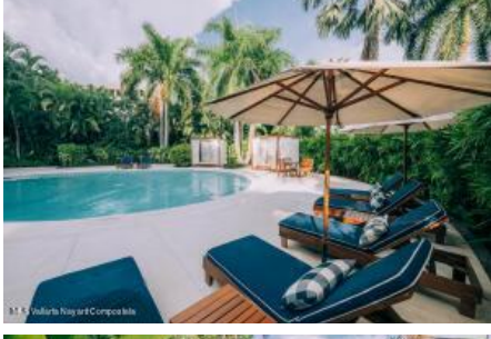
M.S. Valdez Negocios Compañia