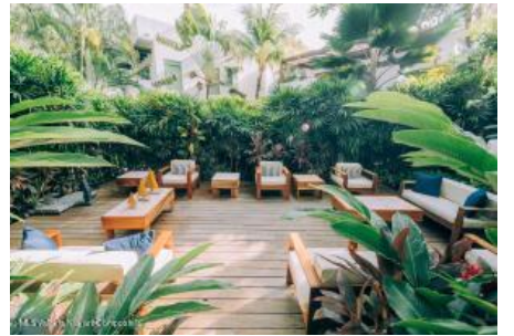
M.S. Valdez Negocios Compañia