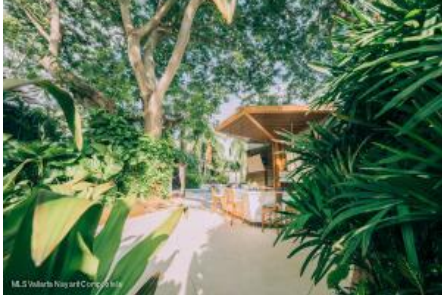
M.S. Valdez Negocios Compañia