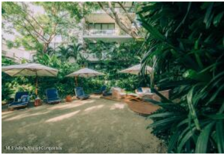
M.S. Valdez Negocios Compañia