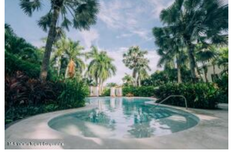
M.S. Valdez Negocios Compañia