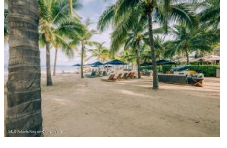
M.S. Valdez Negocios Compañia