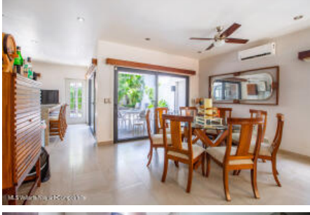
M.S Valdez Real Estate