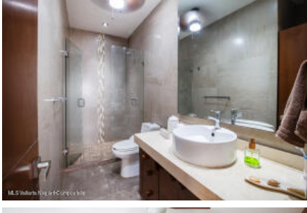
M.S Valdez Real Estate