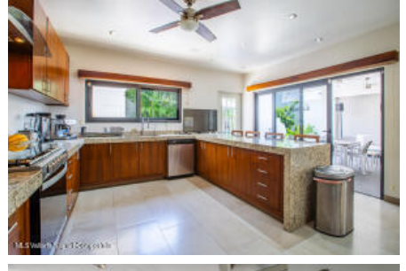
M.S Valdez Real Estate