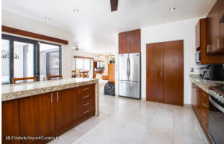
M.S Valdez Real Estate