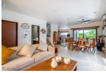
M.S Valdez Real Estate