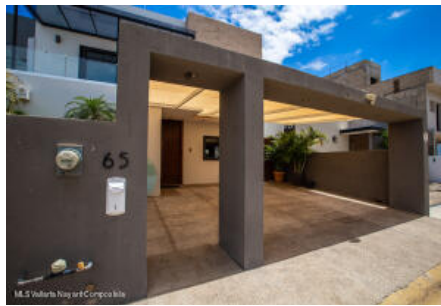
M.S Valdez Real Estate