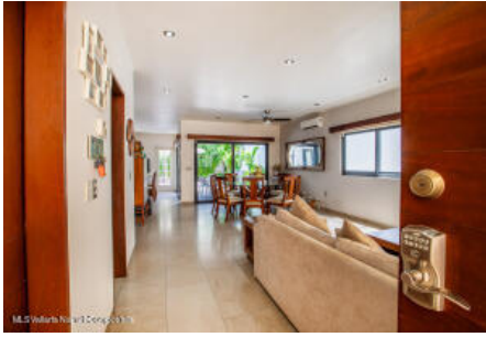
M.S Valdez Real Estate