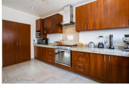
M.S Valdez Real Estate