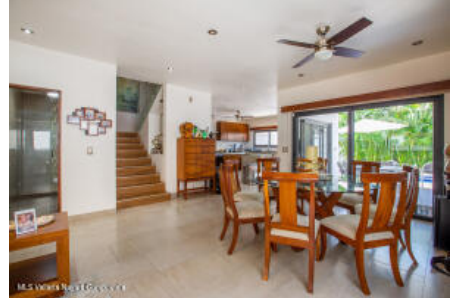
M.S Valdez Real Estate