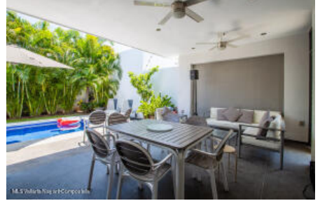
M.S Valdez Real Estate