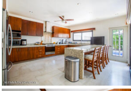
M.S Valdez Real Estate