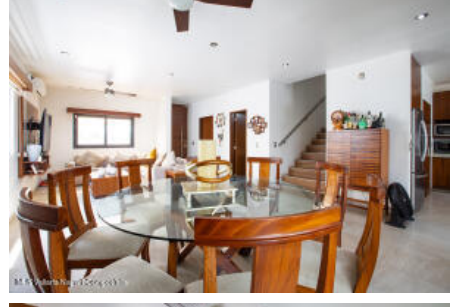
M.S Valdez Real Estate