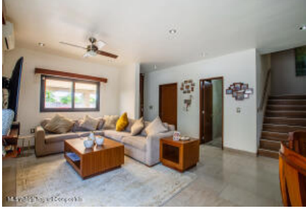
M.S Valdez Real Estate