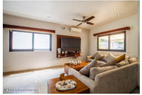
M.S Valdez Real Estate