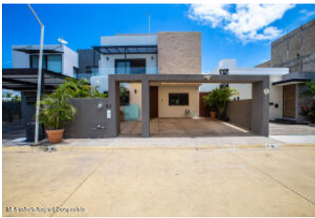
M.S Valdez Real Estate