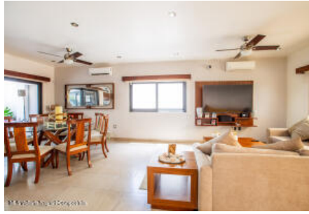
M.S Valdez Real Estate