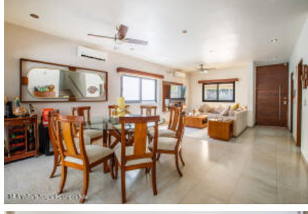
M.S Valdez Real Estate