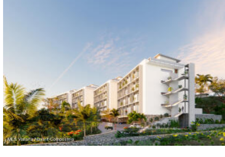
M.S. Valeria Nayarit Compostela