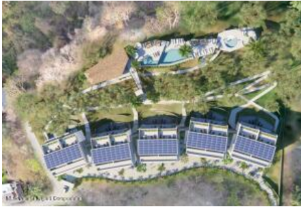
M.S. Valeria Nayarit Compostela