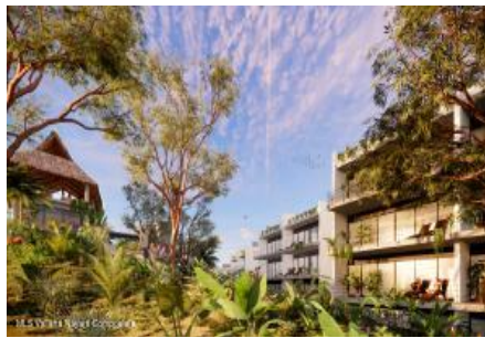
M.S. Valeria Nayarit Compostela