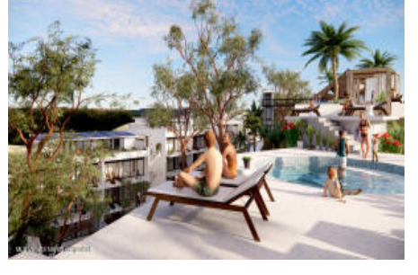
M.S. Valeria Nayarit Compostela