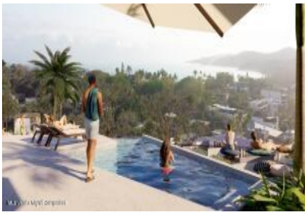
M.S. Valeria Nayarit Compostela