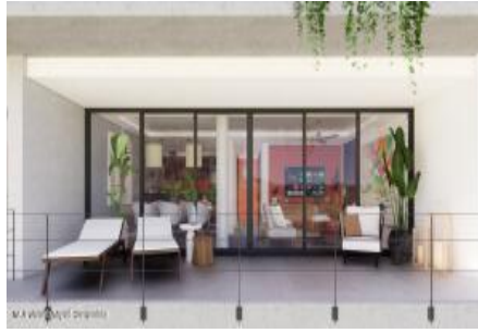
M.S. Valeria Nayarit Compostela