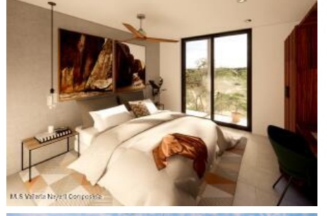
M.S. Valeria Nayarit Compostela