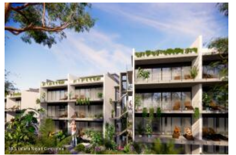
M.S. Valeria Nayarit Compostela