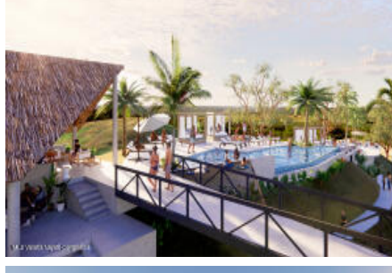
M.S. Valeria Nayarit Compostela