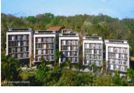
M.S. Valeria Nayarit Compostela