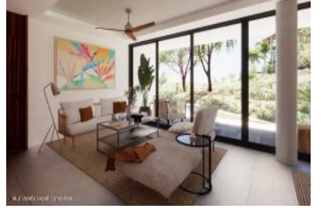
M.S. Valeria Nayarit Compostela