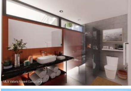
M.S. Valeria Nayarit Compostela