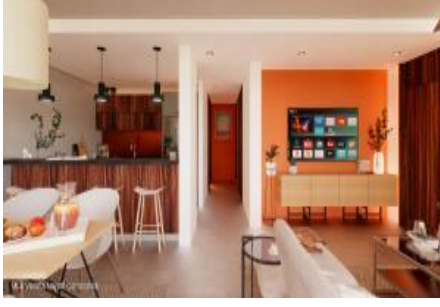
M.S. Valeria Nayarit Compostela