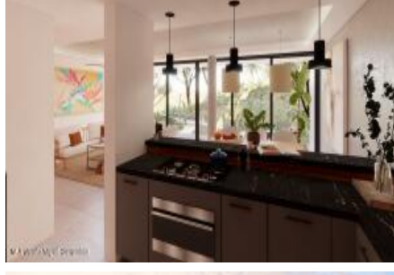
M.S. Valeria Nayarit Compostela