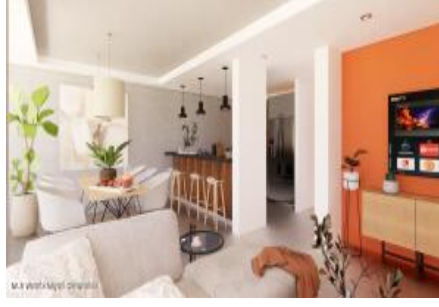
M.S. Valeria Nayarit Compostela