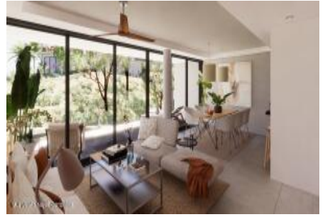
M.S. Valeria Nayarit Compostela