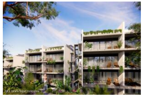
M.S. Valeria Nayarit Compostela